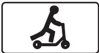
Знак 8.4.7.2 «Лица, использующие для передвижения средства индивидуальной мобильности»