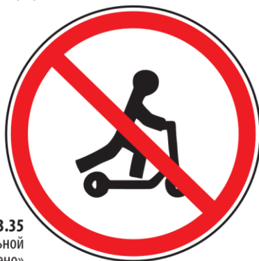
Знак 3.35 «Движение на средствах индивидуальной мобильности запрещено»